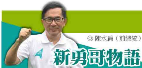
◎ 陳水扁 (前總統)